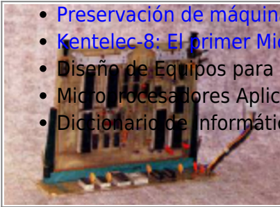
Placa que contenía la memoria y la CPU (Mundo Electrónico, 1975 (Archivado por Old8Bits ))