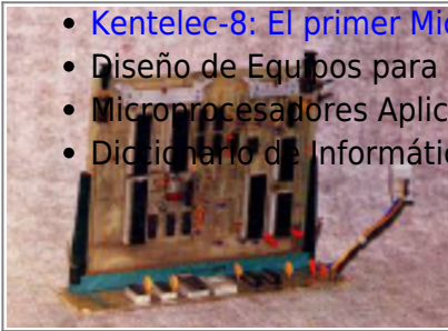
Placa que contenía la memoria y la CPU (Mundo Electrónico, 1975 (Archivado por Old8Bits ))