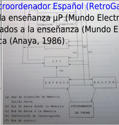
Diagrama de Bloques del Kentelec-8 (Manual de Programación: Kentelec-8, Ditesa 1975 (Archivado por Old8Bits ))