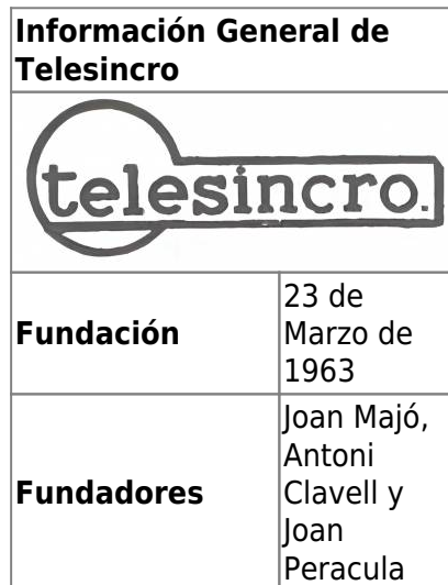
Diagrama de la Historia de Telesincro

Fundada el 23 de Marzo de 1963, Telesincro es considerada la primera empresa de informática española. Esta compañía inicialmente se dedicaba a los automatismos industriales, en específico a los relacionados con los sistemas de posicionamiento de ascensores si nos basamos en las primeras patentes de esta empresa.