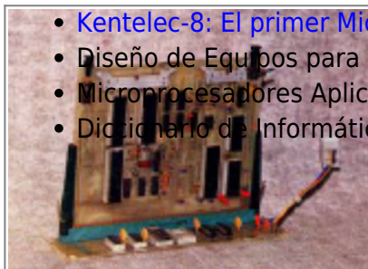
Placa que contenía la memoria y la CPU (Mundo Electrónico, 1975 (Archivado por Old8Bits ))