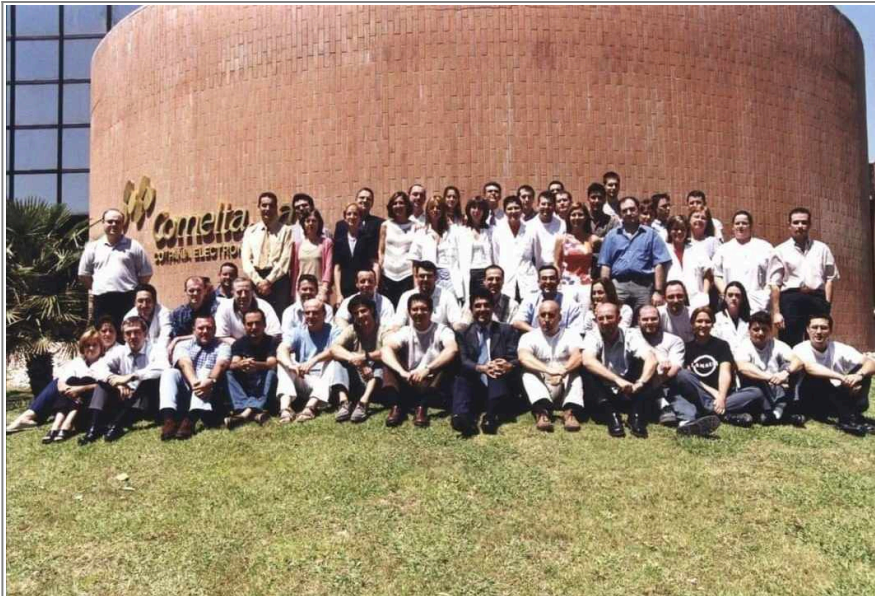
Foto de la Plantilla de Comelta en algún momento entre 2003 y 2004, antes de la venta a Odeco

Por desgracia este grupo empresarial acaba siendo un fracaso, registrando pérdidas millonarias para mayo de 2002, entrando en octubre de este año en suspensión de pagos, lo que resulta en la venta de la división de informática de Comelta a Data Logic, dueña de la cadena de tiendas BEEP, pasando esta a llamarse Comelta Barebone. Poco después se vendería el resto de Comelta a Odeco por 4,2 Millones de euros. A partir de aquí comelta se dedicó al contract manufacturing hasta 2004, cuando la compañía perdió la fábrica del Parque Tecnológico debido a desacuerdos en cuanto a la compra de la antigua factoría. En 2006 un fondo de accionistas compra Odeco y crea el grupo Imago, desapareciendo en algún momento entre 2007 y 2008 toda referencia a Comelta, siendo esta finalmente absorbida por el grupo Imago. En cuanto a Comelta Barebone, la división que fue comprada por Data Logic, siguió operando hasta 2014.