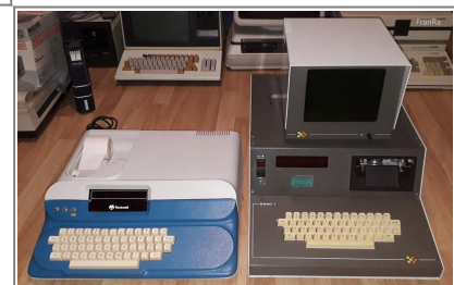
RockWell AIM-65 junto a un Comelta DRAC-1

Un año más tarde, para incrementar su expansión internacional, Comelta se fusiona con múltiples empresas tecnológicas españolas, convirtiéndose en la empresa más grande del sector informático en España. En este momento Comelta ya estaba operando en España, Portugal, Francia y Alemania. Por desgracia, cuando todo parecía ir viento en popa, en 1992 Europa entra en recesión, resultando en un brusco descenso de ventas que condenó la empresa, que acabaría entrando en suspensión de pagos en Diciembre. Por suerte, en 1993 el Banco Central Hispano rescata la compañía y esta puede seguir operando.