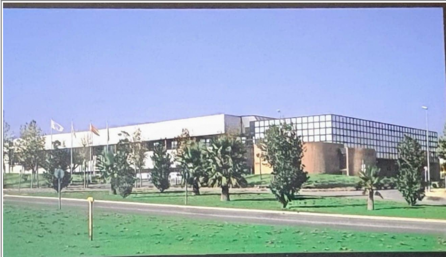
Fábrica de Comelta en los 90

Publicidad del Computec S/1 (Ordenador Personal nº22, 1984)