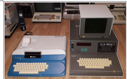
RockWell AIM-65 junto a un Comelta DRAC-1

Un año más tarde, para incrementar su expansión internacional, Comelta se fusiona con múltiples empresas tecnológicas españolas, convirtiéndose en la empresa más grande del sector informático en España. En este momento Comelta ya estaba operando en España, Portugal, Francia y Alemania. Por desgracia, cuando todo parecía ir viento en popa, en 1992 Europa entra en recesión, resultando en un brusco descenso de ventas que condenó la empresa, que acabaría entrando en suspensión de pagos en Diciembre. Por suerte, en 1993 el Banco Central Hispano rescata la compañía y esta puede seguir operando.