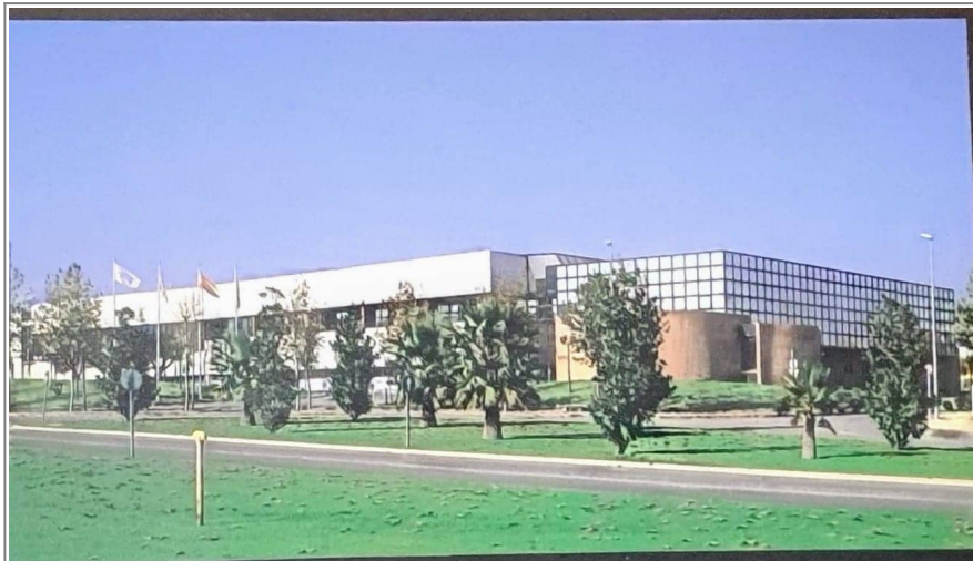
Fábrica de Comelta en los 90

nacional, Comelta se fusiona con múltiples empresas tecnológicas españolas, convirtiéndose en la empresa más grande del sector informático en España. En este momento Comelta ya estaba operando