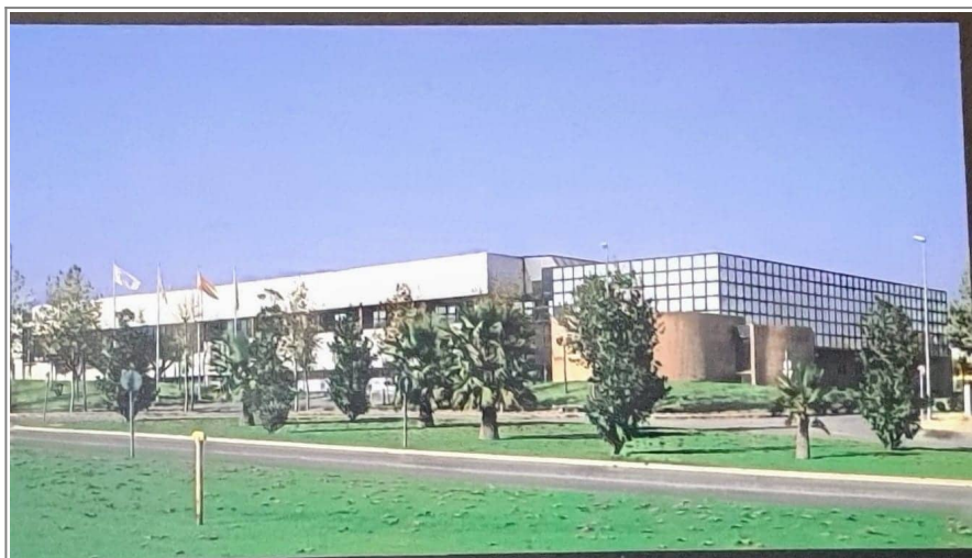
Fábrica de Comelta en los 90

nacional, Comelta se fusiona con múltiples empresas tecnológicas españolas, convirtiéndose en la empresa más grande del sector informático en España. En este momento Comelta ya estaba operando