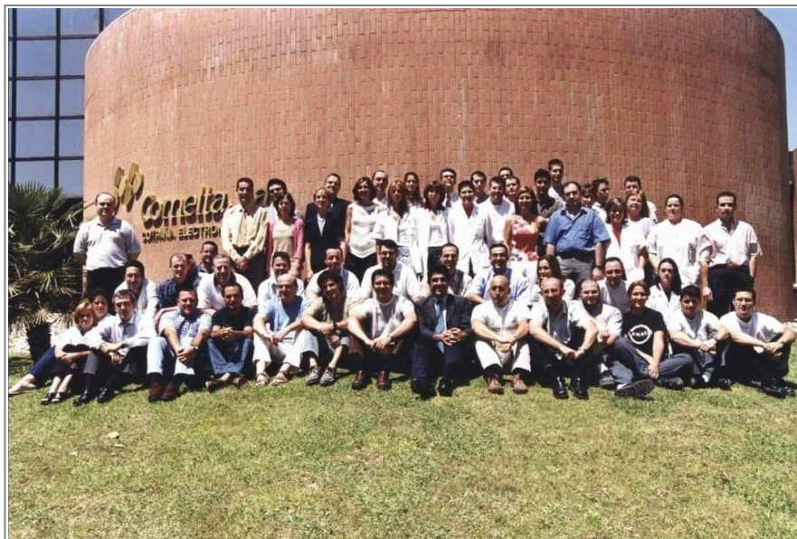
Foto de la Plantilla de Comelta en algún momento entre 2003 y 2004, antes de la venta a Odeco

Por desgracia este grupo empresarial acaba siendo un fracaso, registrando pérdidas millonarias para mayo de 2002, entrando en octubre de este año en suspensión de pagos, lo que resulta en la venta de la división de informática de Comelta a Data Logic, dueña de la cadena de tiendas BEEP, pasando esta a llamarse Comelta Barebone. Poco después se vendería el resto de Comelta a Odeco por 4,2 Millones de euros. A partir de aquí comelta se dedicó al contract manufacturing hasta 2004, cuando la compañía perdió la fábrica del Parque Tecnológico debido a desacuerdos en cuanto a la compra de la antigua factoría. En 2006 un fondo de accionistas compra Odeco y crea el grupo Imago, desapareciendo en algún momento entre 2007 y 2008 toda referencia a Comelta, siendo esta finalmente absorbida por el grupo Imago. En cuanto a Comelta Barebone, la división que fue comprada por Data Logic, siguió operando hasta 2014.